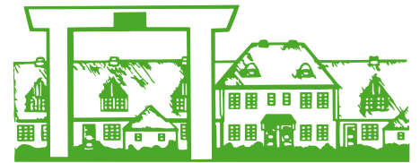
Gemeinschaft der Fritz-Schumacher-Siedlung Langenhorn e.V. seit 1920

Weder für den Posten des 1. Schriftführers noch den des 2. Kassierers (Mitgliederbetreuung) gibt