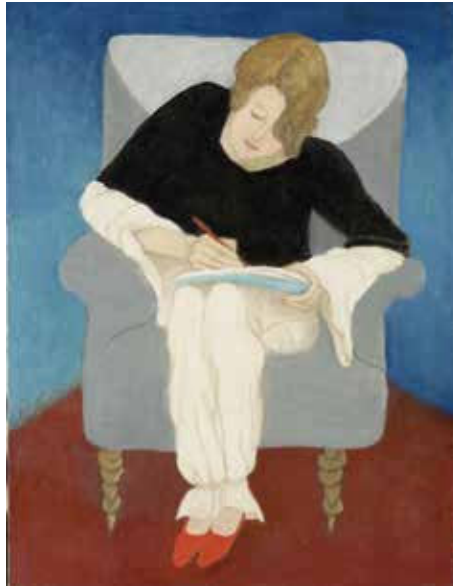
Gabrielle Münter: Dame im Sessel, schreibend (Stenographie. Schweizerin in Pyjama), 1929 Städtische Galerie im Lenbachhaus und Kunstbau München, Dauerleihgabe der Gabriele Münter- und Johannes Eichner-Stiftung, München

Gabrielle Münter führte ihre Werke trotz sozialen Einschränkungen in der besonderen Rolle als Frau, belastet durch ihre persönlichen Krisen (offene Ehe mit Kandinsky) zur künstlerischen Reife. Der Schwer-